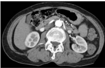
Imagen por TC mostrando estructuras internas del cuerpo

Ambos, los rayos X convencionales y la TC, toman fotos de las estructuras internas del cuerpo. En los rayos X convencionales, las estructuras se superponen. Por ejemplo, las costillas se superponen a los pulmones y al corazón. En una radiografía, las estructuras de importancia médica generalmente se ven oscurecidas por otros órganos o huesos, haciendo difícil el diagnóstico.