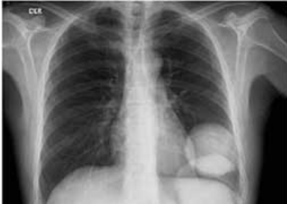
Imagen por rayos X de las estructuras internas del cuerpo

Ambos, los rayos X convencionales y la TC, toman fotos de las estructuras internas del cuerpo. En los rayos X convencionales, las estructuras se superponen. Por ejemplo, las costillas se superponen a los pulmones y al corazón. En una radiografía, las estructuras de importancia médica generalmente se ven oscurecidas por otros órganos o huesos, haciendo difícil el diagnóstico.